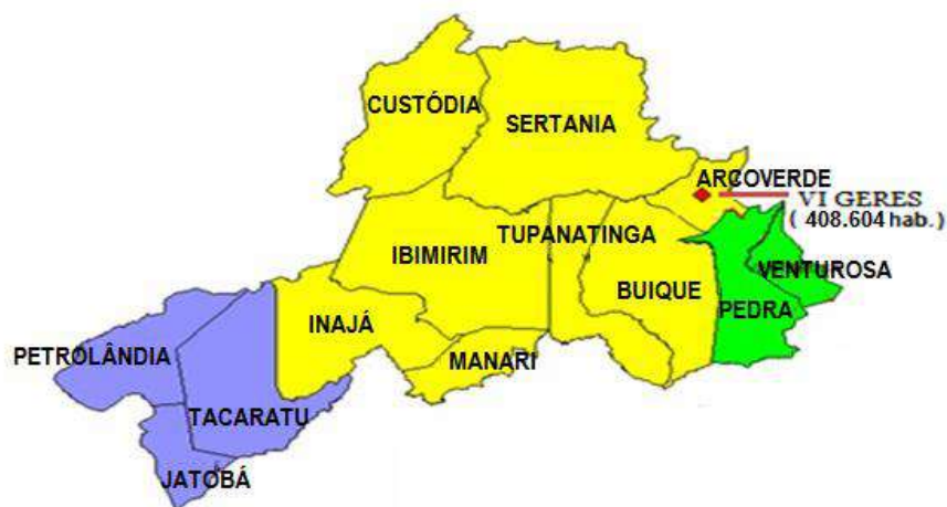
Figura 01 – Mapa dos municípios atendidos pela UPAE de Arcoverde.