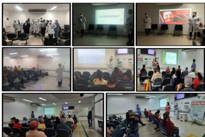
Figura 04 - Eventos Março 2021