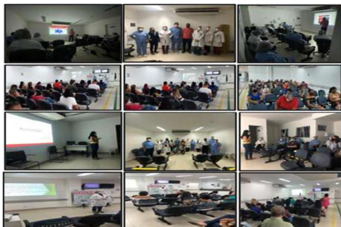
Figura 05 - Eventos Abril 2021