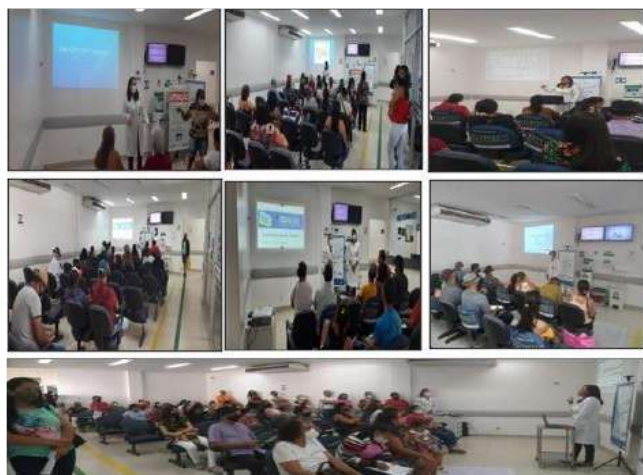
Figura 12 - Eventos Novembro 2021