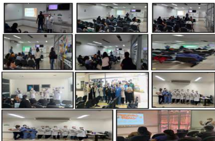
Figura 06 - Eventos Maio 2021