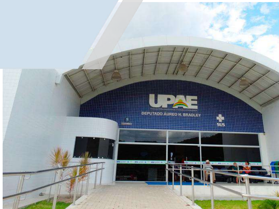
UPAE Arcoverde Unidade Pernambucana de Atenção Especializada