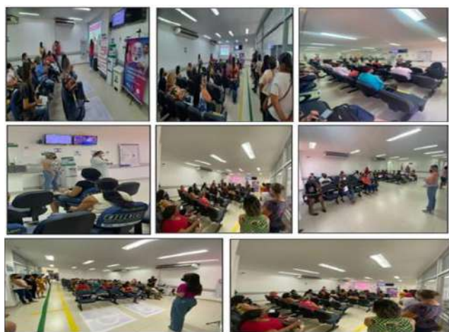
Figura 11 - Eventos Outubro 2021