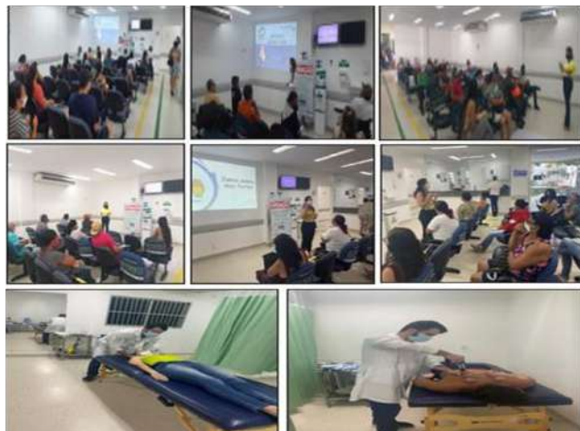
Figura 10 - Eventos Setembro 2021