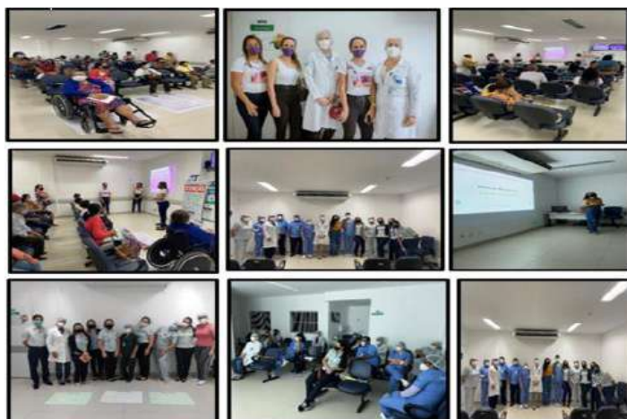
Figura 07 - Eventos Junho 2021