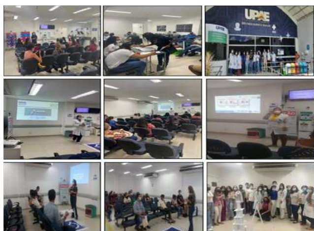
Figura 13 - Eventos Dezembro 2021