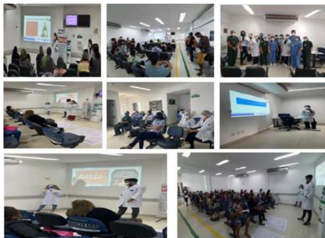
Figura 9 - Eventos Agosto 2021