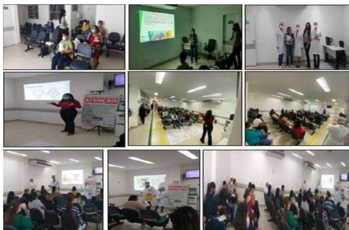
Figura 8 - Eventos Julho 2021